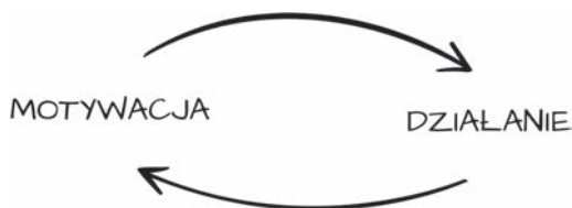
RYСУNEK 7.2. Motywacja to zarówno przyczyna, jak i skutek działania

Na szczęście jest jeszcze druga strona medalu. Gdy w daną czynność zaczniesz inwestować zogniskowany wysiłek, gdy zaczniesz dostrzegać małe rezultaty swojej pracy, pojawia się motywacja albo, precyzyjniej, uczucie zmotywowania (rysunek 7.2).